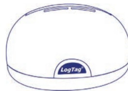
LTI-HID Nicht enthalten