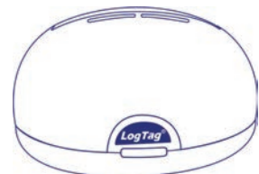
LTI-WIFI Nicht enthalten