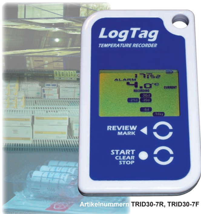
Artikelnummern TRID30-7R, TRID30-7F

Der LogTag TRID30-7 Datenlogger kombiniert eine Temperaturanzeige mit einer Datenaufzeichnungsfunktion für bis zu 7.770 Temperaturmesswerte.